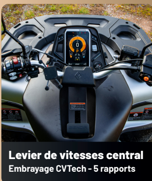
Levier de vitesses central Embrayage CVTech - 5 rapports