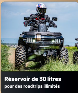
Réservoir de 30 litres pour des roadtrips illimités