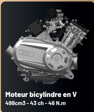
Moteur bicylindre en V 499cm 3 - 43 ch - 46 N.m