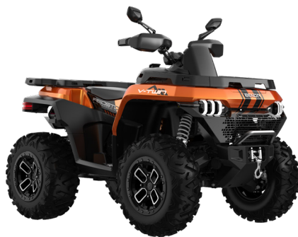
ORANGE FURIOUS ORANGE