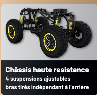
Châssis haute résistance 4 suspensions ajustables bras tirés indépendant à l'arrière