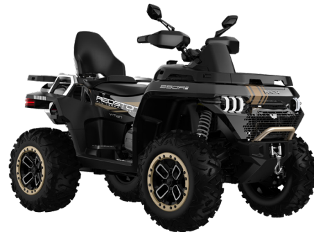
NOIR POLAR NIGHT